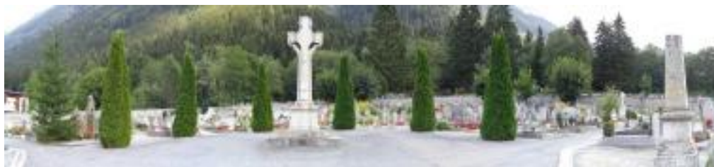
Figure 1 : Vue de la partie centrale du cimetière du Biollay.

« Les cimetières de montagne sont un peu tous identiques. C'est des trucs simples, mais presque accueillants j'allais dire. C'est la sobriété qui fait, y a pas de grosses pierres, y a pas de marbre, y a pas de trucs comme ça, y a pas de grands caveaux contrairement à ce qu'on trouve en ville où y a les caveaux extravagants, énormes, alors que le nôtre il est en souterrain ».